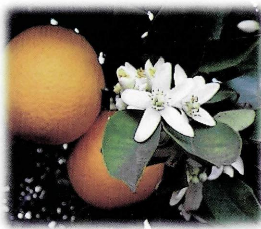
Figura N° 1. FLOR DE AZAHAR