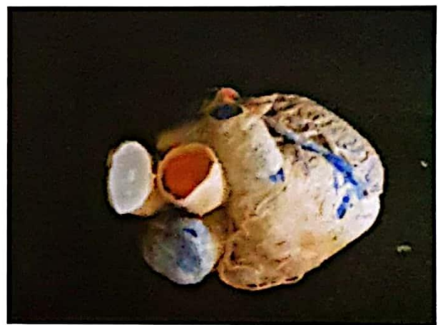
Fotografía N° 3. Aorta ascendente (con color

calibrador digital, marca KAMASA, con lo cual se midió el diámetro y el llenado de la silicona en las diferentes porciones de la aorta, sus ramas colaterales y ramas terminales de una de ellas, obteniéndose los siguientes resultados (tabla N° 1). Por los resultados obtenidos, se observó la variación del diámetro de las arterias que va desde los 22,49 mm en las arterias grandes hasta 0,17 mm en las arterias de las ramas más pequeñas. Fotos N° 3 y 4.