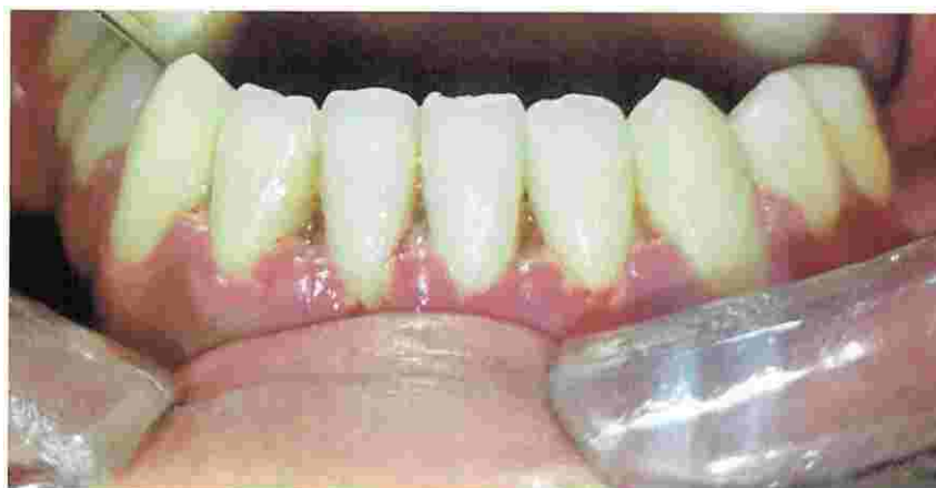
Figura N° 3. Fotografía intraoral, arco inferior con presencia en el sector anterior de ulceraciones, papilas interdentalaes “decapitadas”

Fuente: Clínica Odontológica UNIVALLE La Paz, mayo-junio 2017