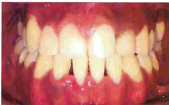
Figura N°9. Fotografía después del tratamiento (donde se evidencia las características de una encía normal)