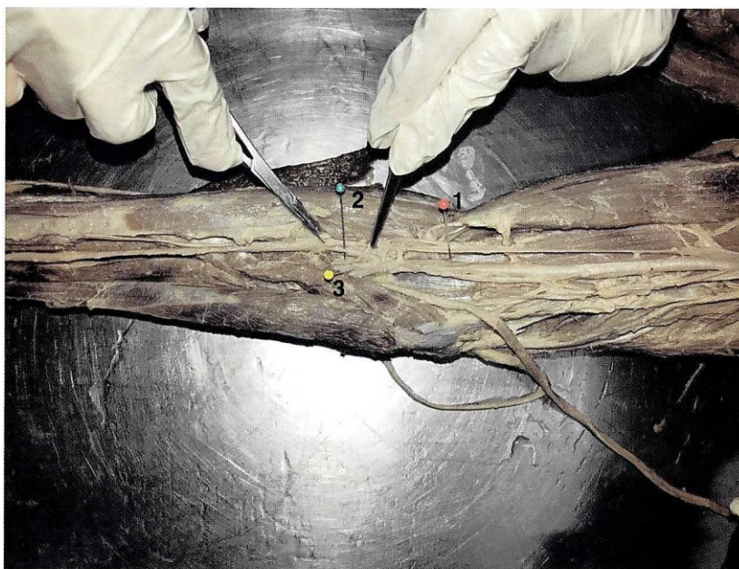
1 Alfiler rojo: arteria braquial 2 Alfiler verde: arteria radial 3 Alfiler amarillo: arteria cubital (ulnar)