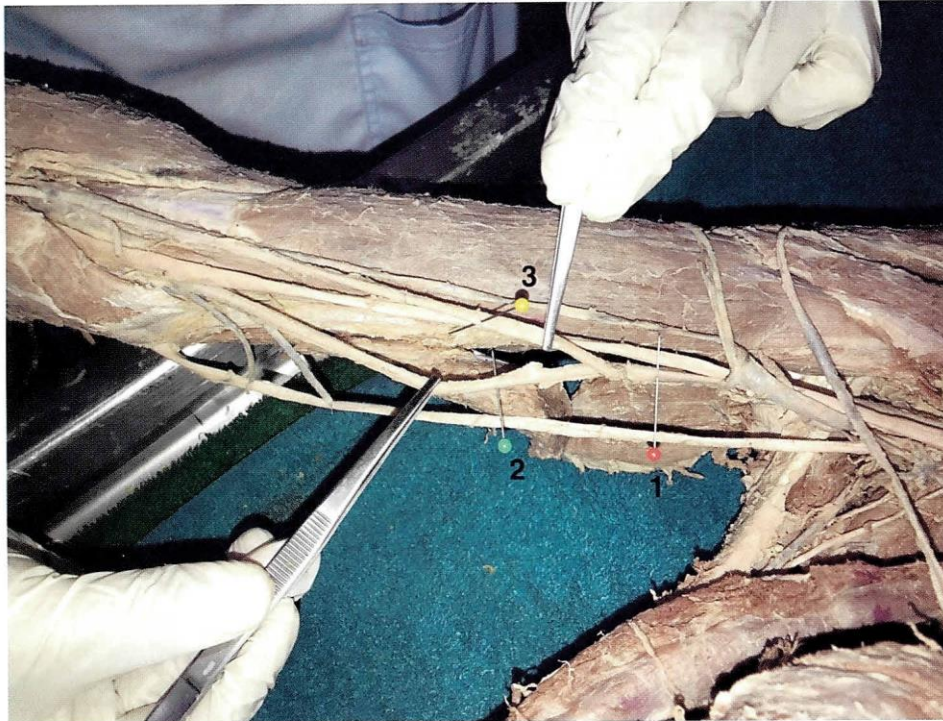
1 Alfiler rojo: arteria braquial 2 Alfiler verde: arteria radial 3 Alfiler amarillo: arteria cubital (ulnar)