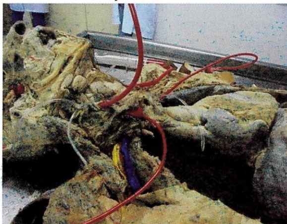
Fotografía N° 1. Canalización con sondas nasogástricas e inyección de silicona roja en las arterias vertebrales y carótidas internas

Posteriormente, se lavó con agua potable y luego con una solución de agua oxigenada (1:10) utilizando una jeringa de 60 ml. Se verificó la anastomosis del círculo arterial cerebral permeabilizando la luz arterial, o sea, el paso del líquido al lado contrario de la arteria carótida interna, para luego inyectar la silicona acética roja modificada, que permitió visualizar la trayectoria que tiene el líquido en las arterias cerebrales. El volumen de silicona acética modificada perfundido fue como término medio de 80 cc por las arterias carótidas y de 20 cc por las arterias vertebrales. El tiempo de endurecimiento de la silicona inyectada fue de 24 horas. En la fotografía N° 1 se muestra la preparación de los cadáveres para la inyección respectiva de la silicona acética roja modificada.