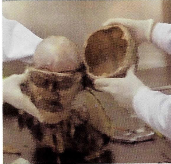
Fotografía N° 2. Separación de la bóveda craneana y visualización de la duramadre craneana