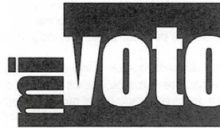
Figura N° 1. Logotipo: Nombre y slogan de la revista

De tal manera, para el desarrollo de la revista se tomó en cuenta un nombre que llame la atención e incluya al público joven en el ámbito político, específicamente en el ejercicio del voto universal en una época electoral.