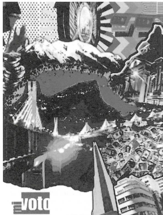
Figuras N° 2, 3, 4 y 5. Diseño de la tapa portada