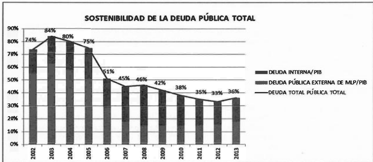
Gráfico N° 2. Sostenibilidad de la Deuda Pública Total