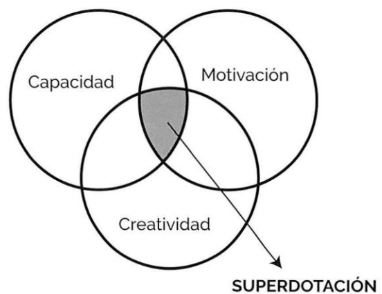
Figura N°1. Modelo de los tres anillos de Renzulli