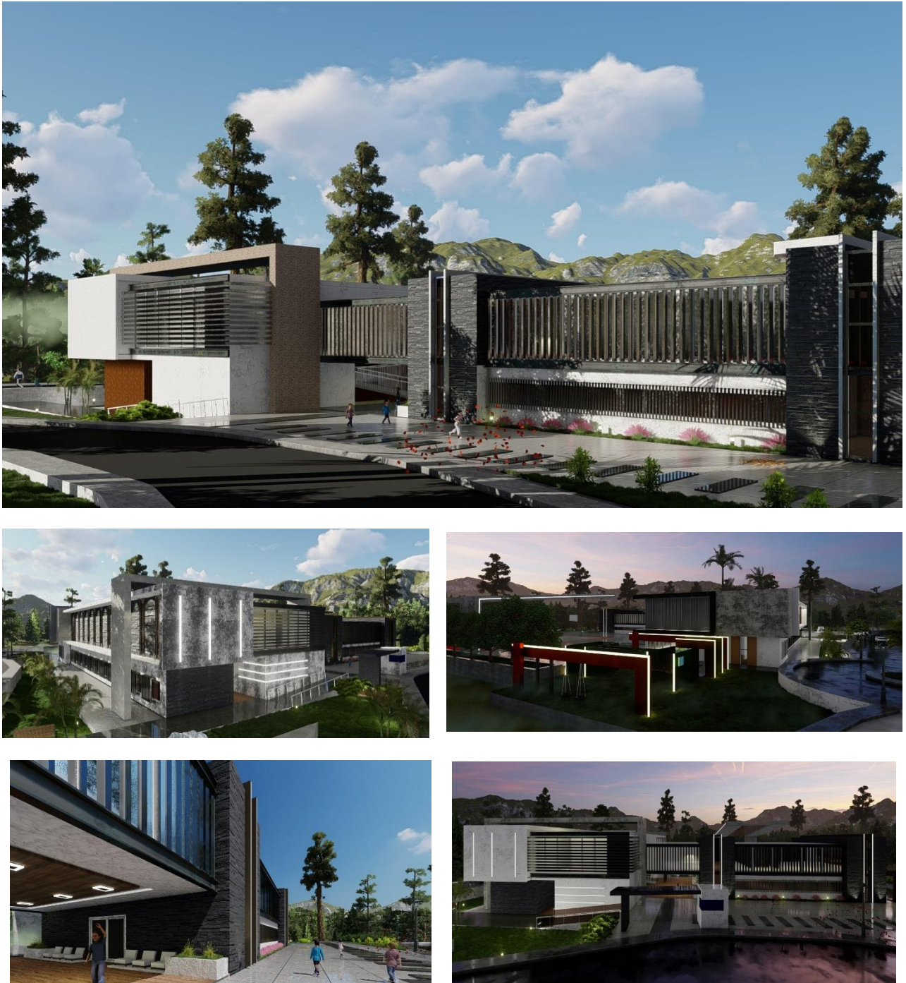
Figura 13. Propuesta de equipamiento de educación – 1.