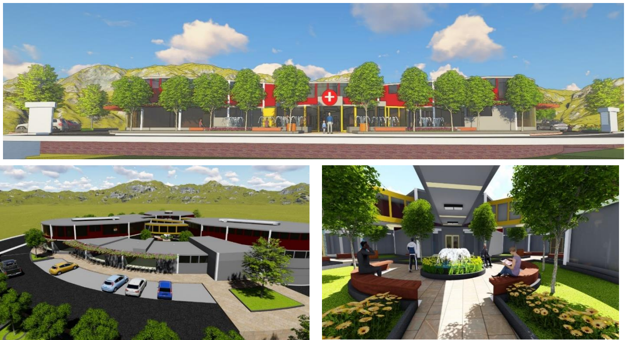
Figura 10. Propuesta de equipamiento de salud – 1.

Durante este proceso de análisis y planeación, será prioritario identificar las enfermedades más frecuentes del lugar, acorde a tasas poblacionales por edades y sexo; así como datos de movilidad de las personas del campo a la ciudad o viceversa, lo cual permita reforzar los lineamientos y pautas de comportamiento en el marco de la salud de los habitantes de distrito y sobre todo de la Comunidad de Chaunaca.