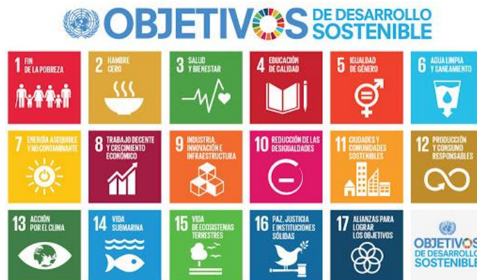
Figura 1. Objetivos de Desarrollo Sostenible

Así mismo, los estados miembros de la ONU, en conjunto con ONGs y ciudadanos de todo el mundo (2015) generaron una propuesta para desarrollar 17 Objetivos de Desarrollo Sostenible (ODS), los cuales buscan alcanzar de manera equilibrada e íntegra tres dimensiones del desarrollo sostenible, tanto en el ámbito económico, social y ambiental de los contextos urbanos y rurales.