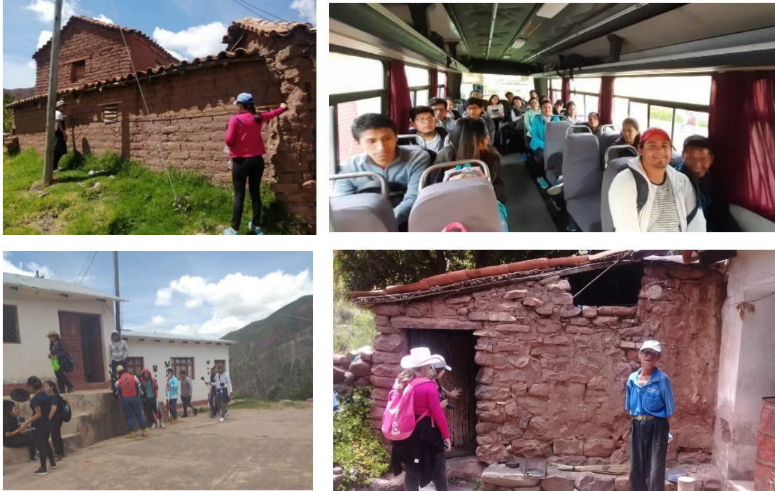
Figura 2. Trabajo de campo, estudiantes de Arquitectura