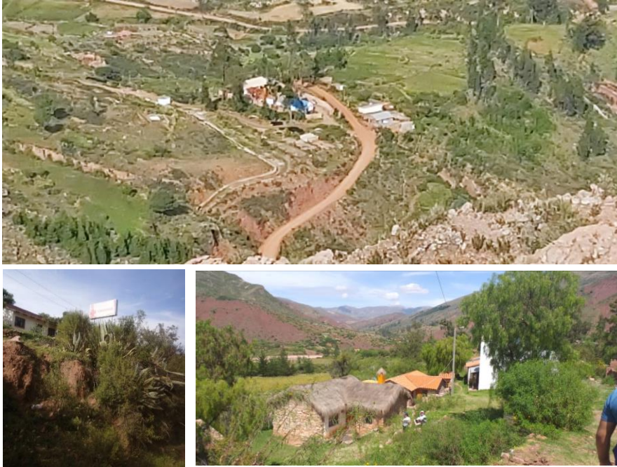
Figura 4. Comunidad de Chaunaca