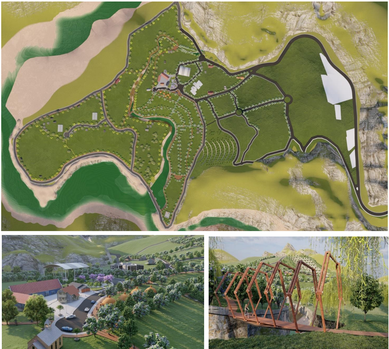
Figura 6. Propuesta de planificación urbana - 1

venta en la zona, a través de la propuesta vial se pueda potenciar la comunicación urbana rural.