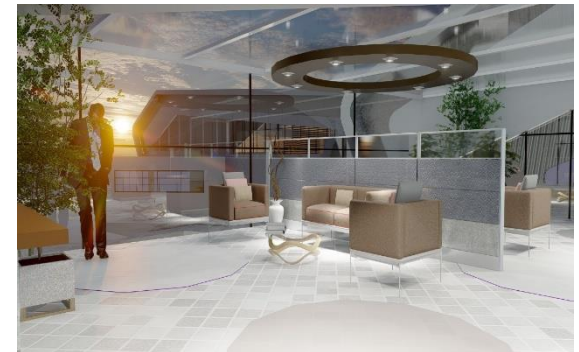
Figura 13. Propuesta de equipamiento de salud – 3.