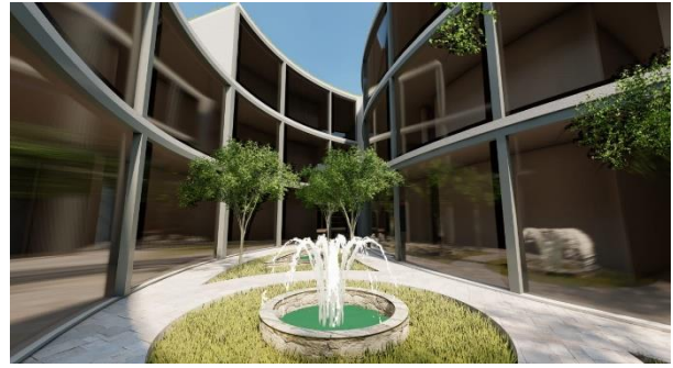
Figura 11. Propuesta de equipamiento de salud - 2