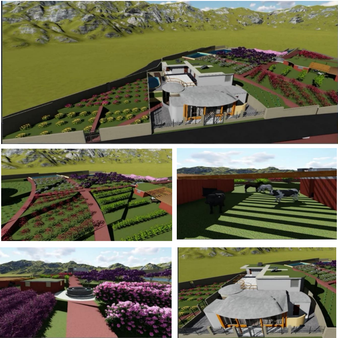
Figura 9. Propuesta de vivienda productiva - 2