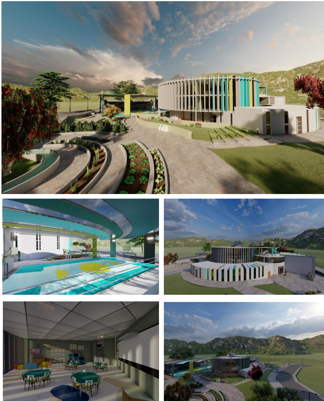
Figura 14. Propuesta de equipamiento de educación – 2.