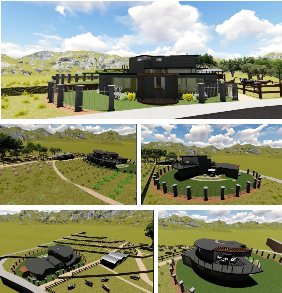
Figura 8. Propuesta de vivienda productiva - 1