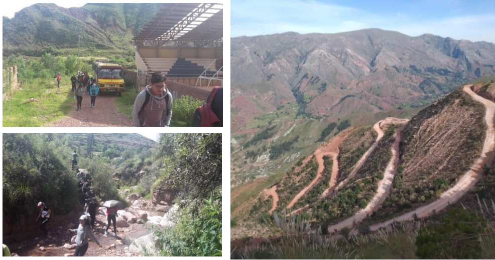
Figura 5. Condiciones topográficas de Chaunaca