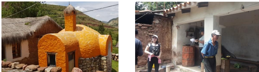
Figura 3. Exploración de situación económica-productiva