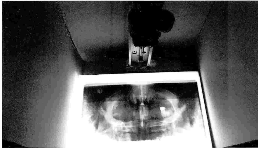
Figura N°2. Visualización de placa dentro del hardware

provoca una eficiente caracterización de la imagen.