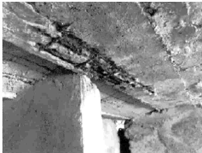
Fotografía N°2. Ausencia de recubrimiento en armadura expuesta presentando corrosión

Fonseca et al. (2008) observó que, por tratarse de edificaciones en la región del litoral, hay mayor presencia de iones cloruro y, por tanto, elevados niveles de corrosión en la edificación. Se detectaron puntos de corrosión en la armadura en la edificación, conforme ilustra fotografía N°2, ocasionando deterioro del concreto. Como causa de esta manifestación patológica, se puede citar la falta de cobertura mínima que es establecida por la NBR 6118 (2014), facilitando infiltraciones y una posterior corrosión de las armaduras.