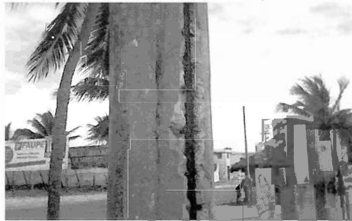
Fotografía N°6. Duchas