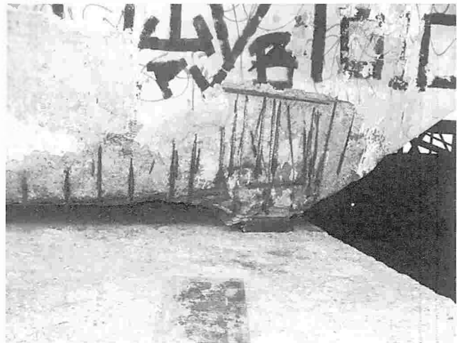
Fotografía N°1. Armadura expuesta presentando corrosión

Los sectores de apoyos extremos de la superestructura son alcanzados por el agua cuando ocurren las mareas máximas. Se observa un elevado grado de deterioro del concreto y corrosión de la armadura. La fotografía N°1 presenta la ausencia de la capa de recubrimiento de la armadura, además de un elevado grado de corrosión y contacto directo con los aparatos de apoyo.