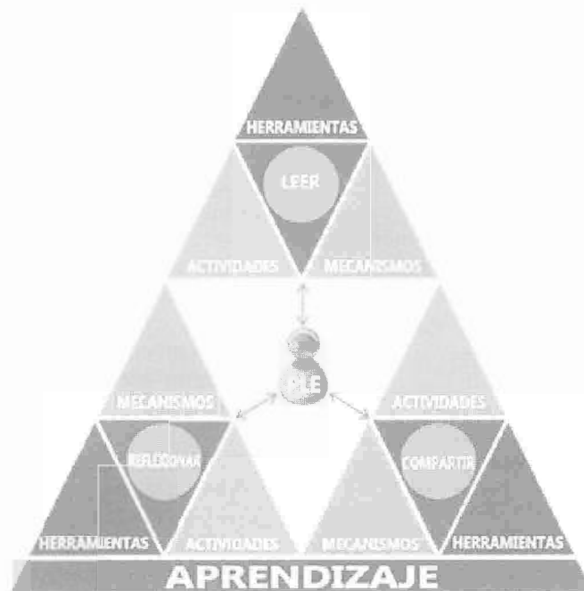
Figura Nº 1. Arquitectura de los PLE

Es en este sentido que se plantea un modelo para la construcción de Entornos Personales de Aprendizaje en base a Office 365, donde se plantea la siguiente arquitectura para entender estos PLE, y donde el resultado final es el aprendizaje plasmado en un individuo (docente o estudiante), entonces un PLE es individual de cada persona, donde se aprende de una manera estratégica desde sus tres componentes básicos que son leer, reflexionar y compartir la información, además que en cada uno de estos componentes se hace una selección de las herramientas de Office 365, mecanismos y actividades.