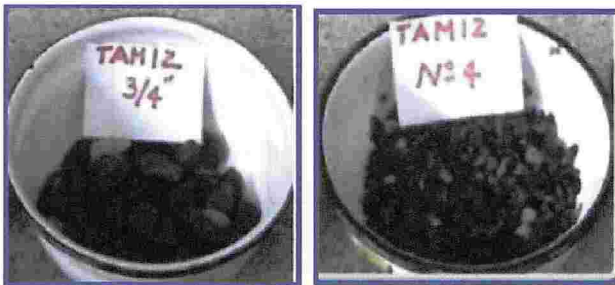
Figura 12. Solubilidad de los agregados (intemperismo)

El índice de desgaste de un árido está relacionado con su resistencia a la abrasión. El método consiste en analizar granulométricamente un árido grueso, preparar una muestra de ensayo que se somete a abrasión en la máquina de Los Ángeles y expresar la pérdida de material o desgaste como el porcentaje de pérdida de masa de muestra con respecto a su masa inicial.