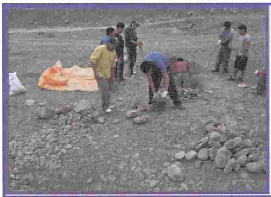
Figura Nº 5. Selección de los materiales que conforman el yacimiento

Se hicieron las excavaciones de los pozos (calcatas a cielo abierto) de 1.60 m a 2.00 m. de profundidad X 0.80 a 1.20 m. de ancho X 1.5 aproximadamente, de estos pozos se desenterró material para ser debidamente reducido por medio del cuarteo obteniendo una muestra representativa de toda la excavación, para su posterior traslado a la Universidad (Laboratorio de Hormigones).