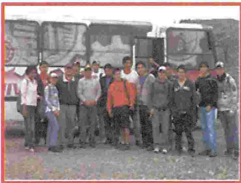
Figura N° 2. Traslado al sitio de estudio