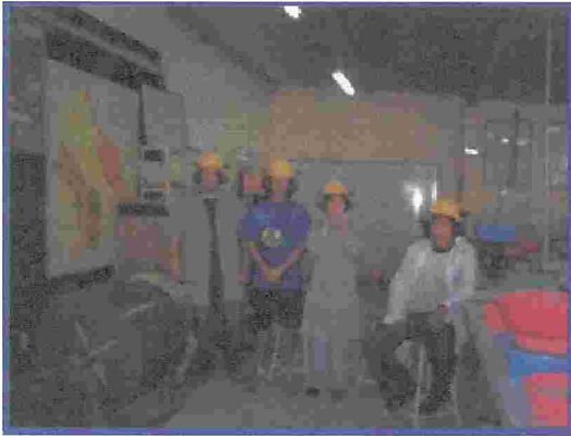
Figura N° 11. Desgaste del agregado grueso – máquina de los ángeles