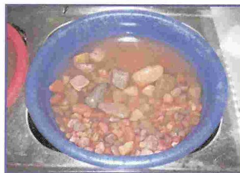
Figura N° 10. Peso específico y absorción de los agregados.

El objeto de este ensayo es de encontrar la distribución granulométrica de los áridos gruesos y finos separados por medio de los tamices con aberturas cuadradas.