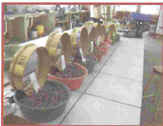
Figura N° 9. Gradación de los agregados (granulometría)