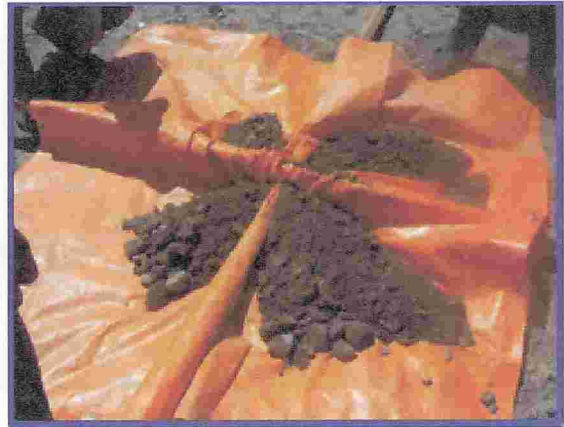
Figura Nº 6. Cuarteo de los agregados grueso y fino

Para asumir la representación de los diferentes tamaños de los áridos materiales extraídos de los pozos que conforman el yacimiento, se procedió a seleccionarlos por tamaños para cuantificar el volumen útil existente dentro del área de estudio de los áridos.