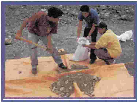
Figura N° 8. Embolsado del material para su traslado al laboratorio