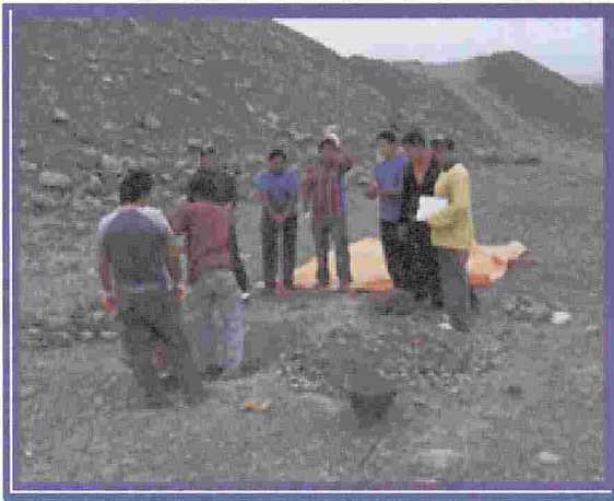
Figura Nº 4. Excavación

Para el trabajo de extracción y recolección de muestras se utilizó equipo de seguridad y herramientas de trabajo y equipos de Topografía.