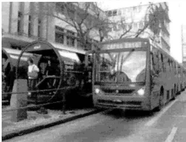
Figura N°3. Sistema de transporte: autobús