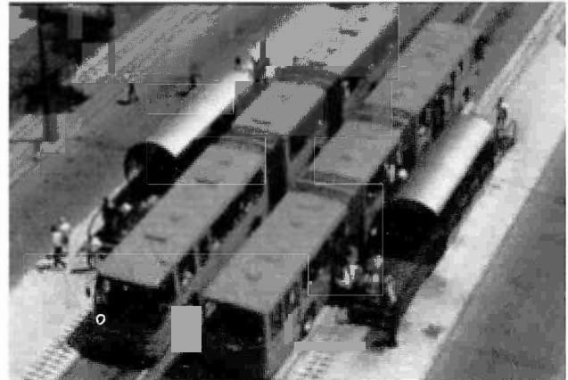
Figura N°4. Vista aérea del autobús y su parada