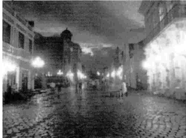
Figura N°6. Centro Histórico de Curitiba peatonalizado