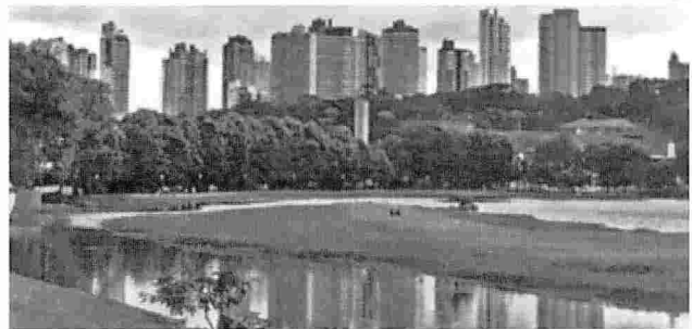
Figura N°5. Equilibrio de la ciudad de Curitiba con la naturaleza